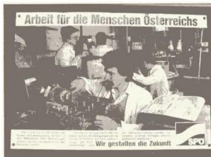
Die SPÖ brüstet sich auch noch damit: Die Regierung hat Österreich bei den Multis angestellt. (Im Bild: ITT)

ropäischen Industrie vollberechtigt mit.“ (»Stellungnahme der VÖI zur Europäischen Integration«, Juni 1987). Seit Mai 1988 hat die VÖI ein Büro bei der „EG“ in Brüssel, mit einem ständigen Vertreter. Christian Beurle, der langjährige Präsident der VÖI, ist UNICE-Vizepräsident.